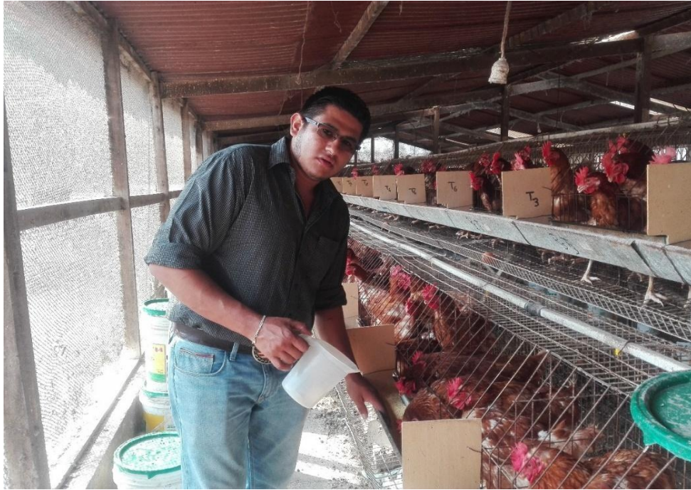
Distribución de las dietas experimentales