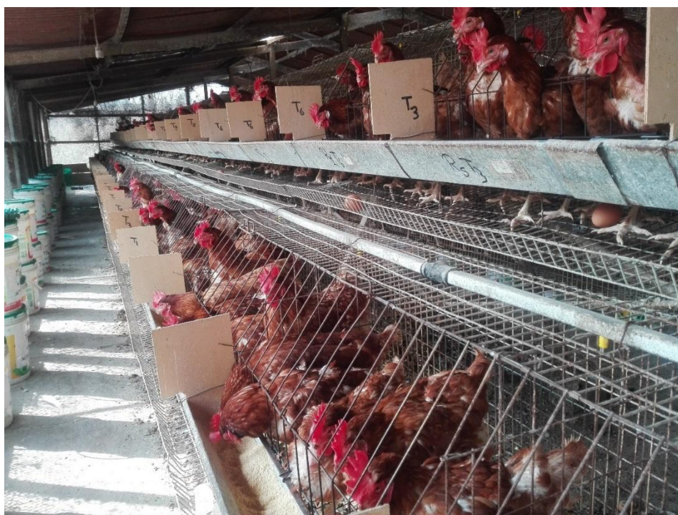
Distribución de animales experimentales