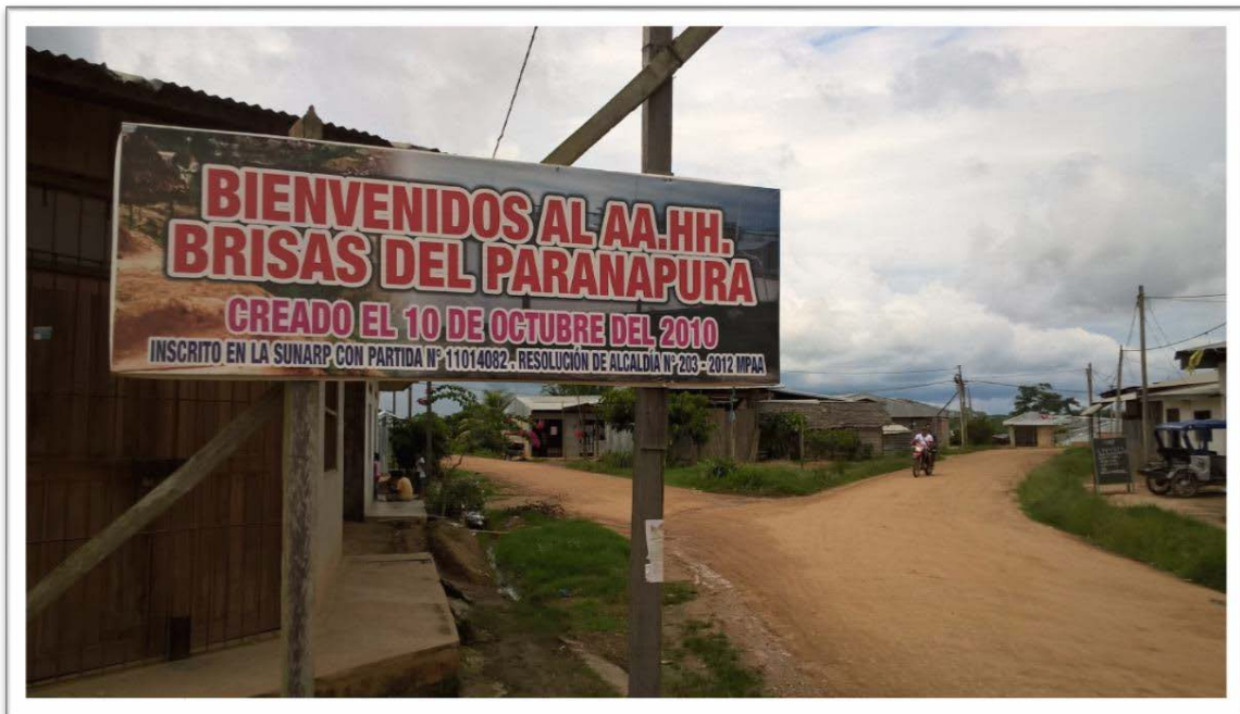
Anexo 6: Cartel de bienvenida en la entrada del A.H. “Brisas del Paranapura”