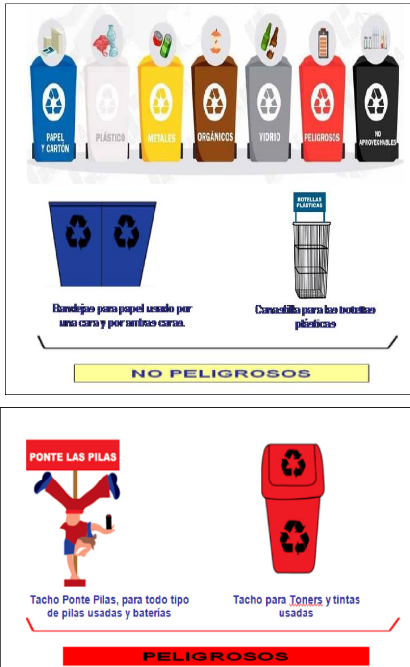
Figura 4. Contenedores para segregación de residuos. Plan de manejo y minimización de la Empresa Minera AB 2022.

Tener en cuenta que en caso de que se genere algún residuo peligroso, que corresponda a un producto químico vencido o que ya se encuentre en desuso, el área o persona generadora de residuos, es responsable de la segregación, rotulado y embalaje según su hoja de seguridad (HDS) con la finalidad de evitar derrames o algún riesgo por sus propiedades (Empresa Minera AB, 2022).