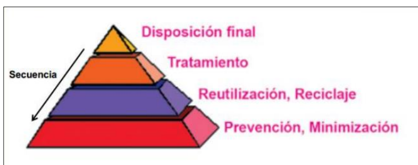
Figura 2. Jerarquía de estrategias para una adecuada gestión de residuos. Orden de preferencia de medidas a reducir y gestionar residuos.

En el marco de una política de gestión integral de residuos acorde con el desarrollo sostenible, es necesario definir un principio de jerarquías en las estrategias de gestión las cuales tendrán como primera prioridad evitar la generación de residuos en la fuente, dejando la alternativa de disposición final como última opción de manejo (Ministerio del Ambiente, 2015), lo cual la Figura 2 ilustra la sujeción de estrategias para una adecuada gestión propuesta.