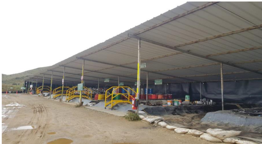
Figura 9. Estación de transferencia