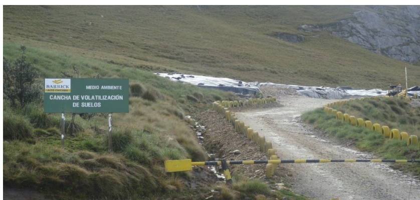
Figura 10. Cancha de volatilización

El agua de lluvia que cae en el área cubierta de la cancha de volatilización (Figura 10) es conducida hacia una poza de colección donde se colocan salchichas y paños absorbentes de manera preventiva para la absorción de hidrocarburos y también se realizan monitoreos para evaluar la calidad del agua.