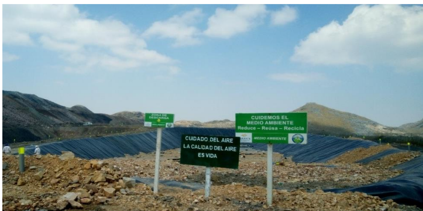
Figura 8. Relleno Sanitario La actual disposición final de residuos no peligrosos se encuentra dentro de la Empresa Minera AB.