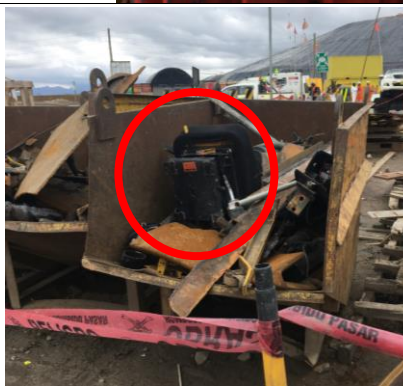
Tabla 10: Verificación del cumplimiento de la normativa sobre el manejo de residuo mientras se realizaba la visita en campo