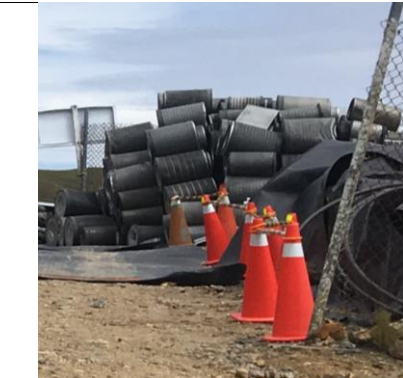
Tabla 10: Verificación del cumplimiento de la normativa sobre el manejo de residuo mientras se realizaba la visita en campo