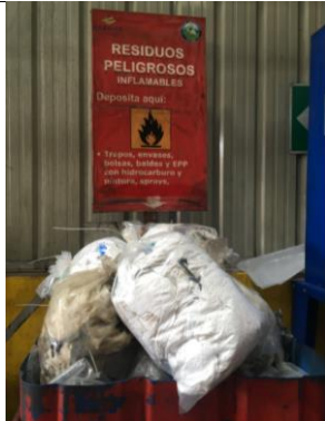
Tabla 10: Verificación del cumplimiento de la normativa sobre el manejo de residuo mientras se realizaba la visita en campo