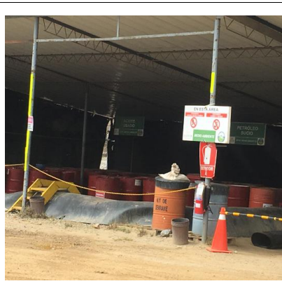
Tabla 10: Verificación del cumplimiento de la normativa sobre el manejo de residuo mientras se realizaba la visita en campo